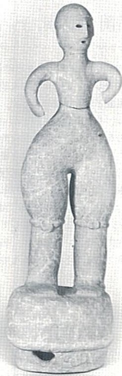
飾袴をつけた男子