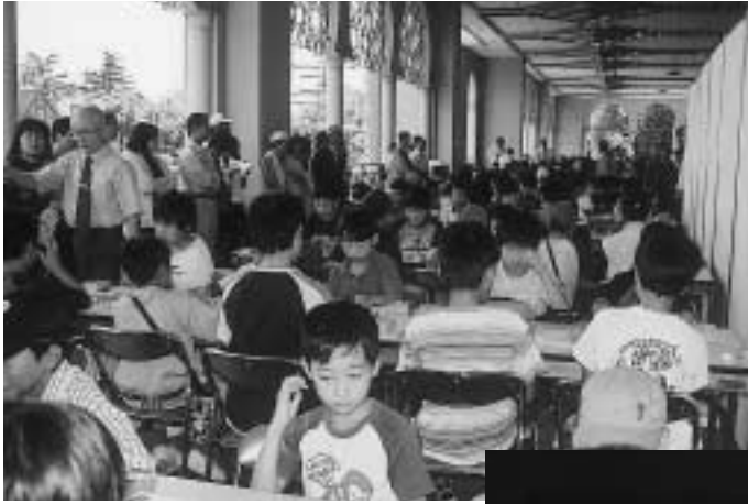
〈小・中学生将棋大会〉