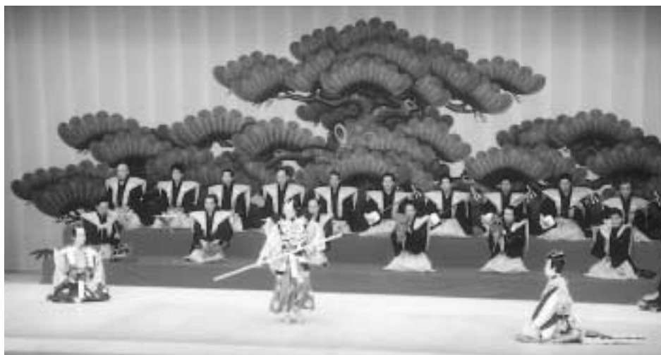
〈棒しばりの一場面〉