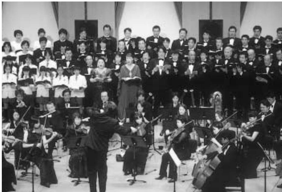
〈第九第4楽章の一場面〉