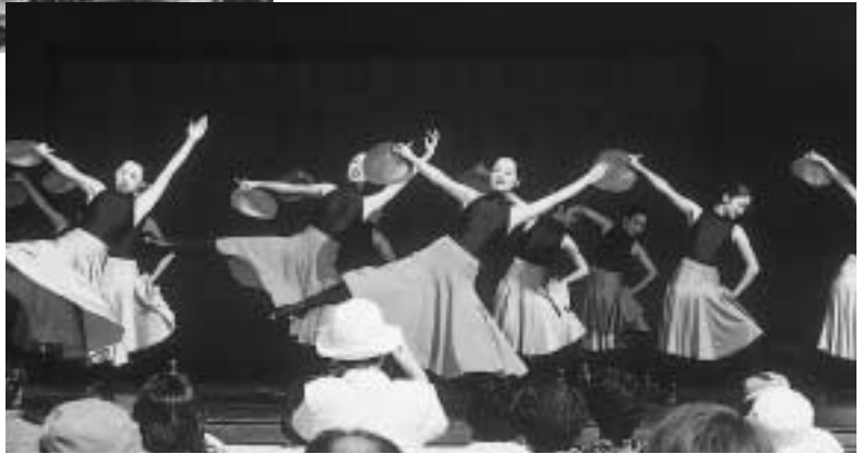
〈ステージの部発表〉