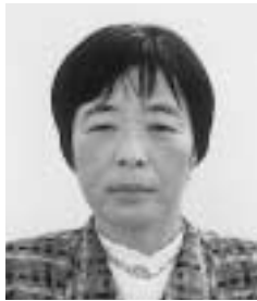
小説B 佳作 白神由紀江