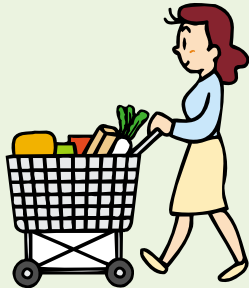
スーパーで買い物をする