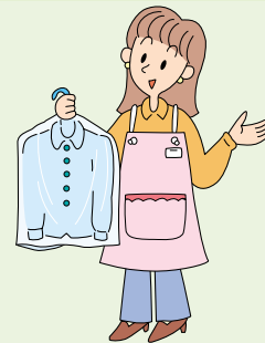
クリーニングに出す