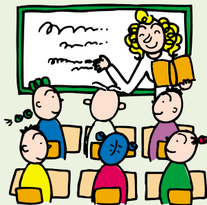
英会話教室に通う