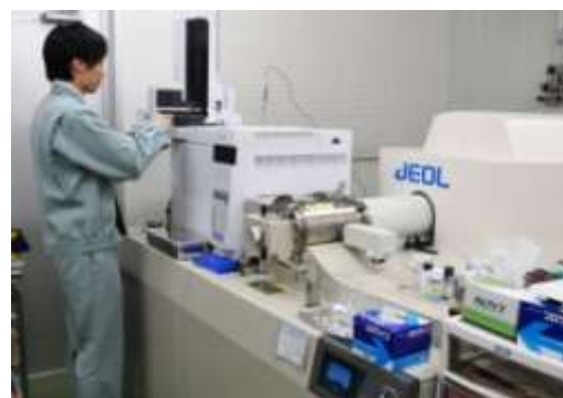
高分解能ガスクロマトグラフ質量分析計

平成24年度は、食品添加物や洗剤に含まれるメチル＝ドデカノアート (*)1 と、日焼け止めに含まれる4-メチルベンジリデンカンファー (*)2 の2物質について測定方法を開発しました。また、従来は約160種類の農薬を一斉に分析できていましたが、さらに除草剤、殺菌剤、殺虫剤を中心とした、食品中の残留基準が設定されている農薬を加えた約320種類について一斉分析できる方法を開発しました。このような調査研究により、産業廃棄物の不法投棄等の緊急事案が生じた際、速やかな原因物質の特定ができる可能性が広がりました。