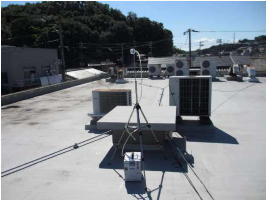
《一般環境中のアスベスト測定の様子》