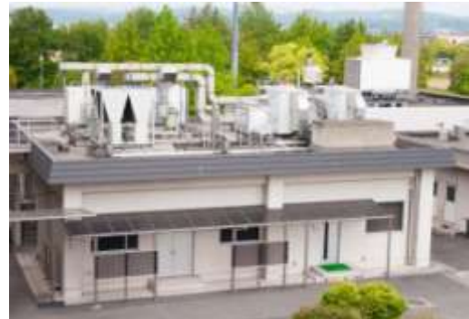
超微量化学物質分析施設

このため、施設外からの妨害物質の混入を防止する設備等を備えた専用の「超微量化学物質分析施設」に、「ガスクロマトグラフ質量分析計」や「液体クロマトグラフ質量分析計」などの高性能な分析機器を備えて、不法投棄された産業廃棄物等に含まれる有害化学物質の分析による、迅速な緊急時対応が行える体制を整えています。