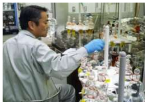
化学物質の分析作業の様子

このため、環境保健センターでは、迅速かつ高度な分析を実施するための研究を行っており、未だ分析方法が確立していない化学物質の分析法開発を行うとともに、分析水準の維持に努めています。また、汚染実態が未解明の化学物質については、環境中での残留状況の調査を行っています。