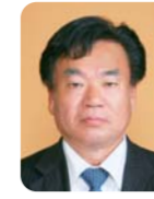
波多 洋治 議員 (自由民主党)

22年度の児童生徒の暴力行為は、全国最悪だった。85回派遣し、支援を行った。教員が毅然たる態度で指導に当たれるよう、教委と管理職が連携してバックアップする体制づくりが重要だ。