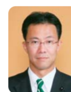
高原 俊彦 議員 (自由民主党)

本県の経済・雇用情勢は依然として厳しい状況であるが、雇用創出関係基金事業は一部を除き今年度が最終年度となっている。中でも「まちかど労働相談事業」は、各インフラサポートセンターと連携しながら事業を展開しているが、労働問題全般にわたる相談事業のほか、ポルトガル語等での生活全般にわたる相談を実施し、外国人労働者へ対応して無くてはならないものとなっている。