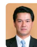
笹井 茂智 議員 (自由民主党)

めざせ「1」園芸作物アスリート事業は、各産地の販売額によって補助率が変わるため、新産地の育成が図られる。次世代フルーツやアスパラガス等の戦略作物や新規作物の産地育成には、事業の見直し等が必要と考えるが、いかがか。