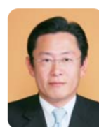
増川 英一 議員 (自由民主党)

近年の景気状況や東日本大震災の影響等により、企業側のニーズも厳しく、本年4月から制度導入の神奈川県の事例を参考に、本県も同様の制度を実施できるような、現在、募集に向けた作業を進めている。