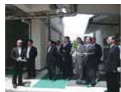
倉敷天城中・高校を視察

(他の調査事項)授業改革支援事業研究指定校(新見市立正田小学校)、特別支援教育活動(県立岡山東養護学校、学科新設県立高梁城南高等学校)など