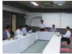
吉備高梁都市きびプラザにて説明聴取

委員からは、吉備高梁都市内の産業界及び住区に係る誘致の進捗状況について、さらには、県の財政構造改革プランの実施による町への影響等についての質問がありました。