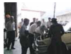
北部高等技術専門学校美作校を視察

(他の調査事項)企業、勝山文化往来館ひしお、玉野署等10警察署、県運転免許センター