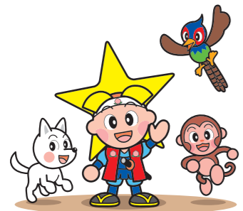
「岡山県マスコットももっちと仲間たち」