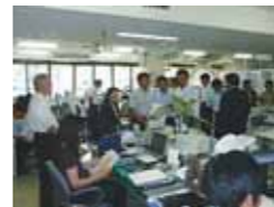
勝英保健所の衛生課を視察