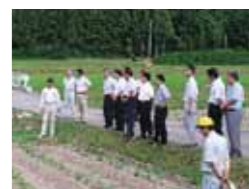
黒大豆枝豆の栽培現場を視察