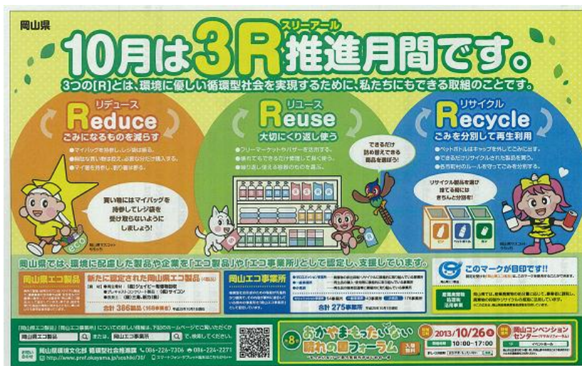
新聞紙面への掲載