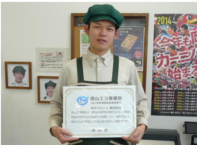
エコ事業所認定銘板