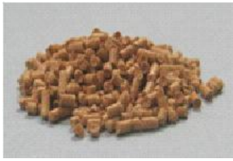
ウッドプラスチック材料