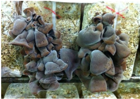
キクラゲ発生状況