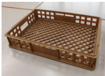
ウッドプラスチック製コンテナ

※射出成形用途のウッドプラスチック材料を改良（耐衝撃性・流動性）して より大型の射出成形品を試作（木質～20%）