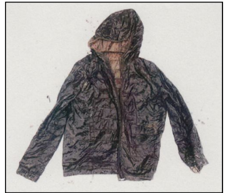
黒色フード付きジャンパー