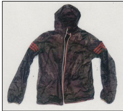
黒色フード付きジャンパー