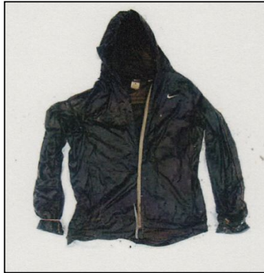
紺色フード付きジャンパー