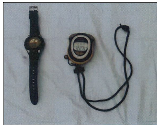
黒色腕時計、ストップウォッチ

お問い合わせ先:岡山県警察本部鑑識課指紋資料係 代表電話:086-234-0110 内線701-325~327