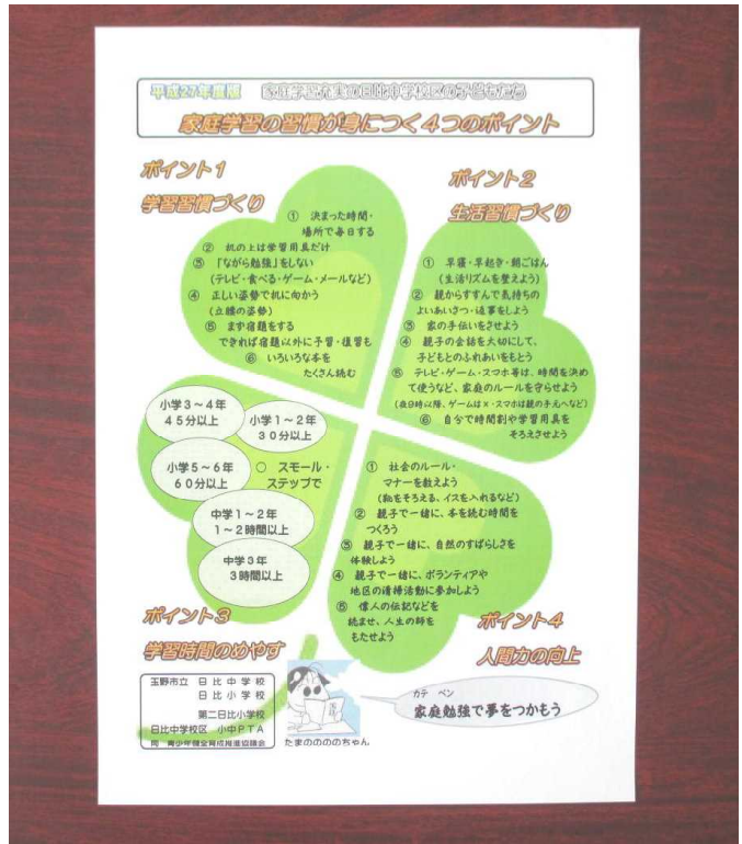
小中合同で作成した「家庭学習の習慣化」に向けた啓発チラシ