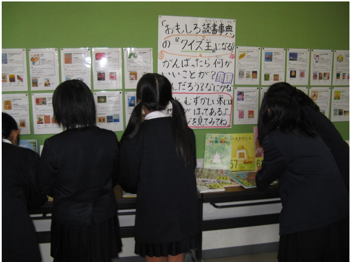
3. 集まった解答カード