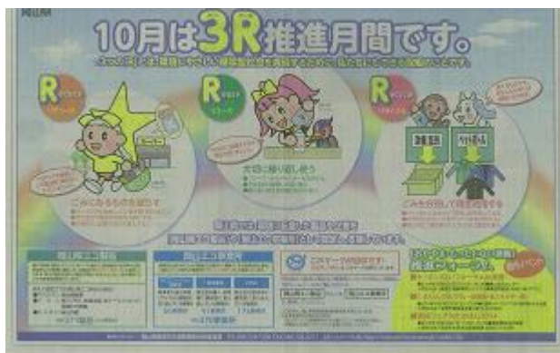
新聞紙面への掲載