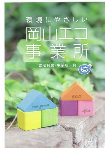
普及啓発用パンフレット