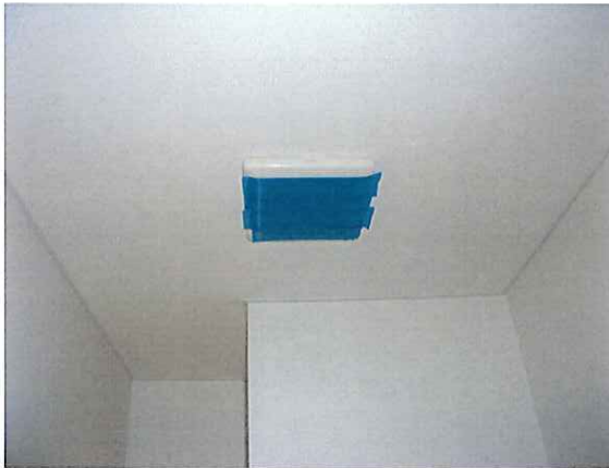
写真：O3_ 便所 換気扇目張り状況