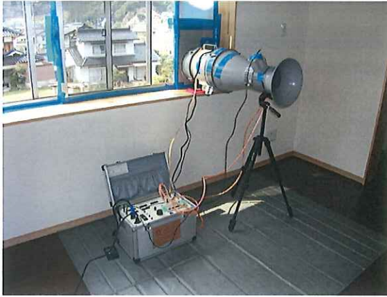
写真：O1_測定装置設置状況