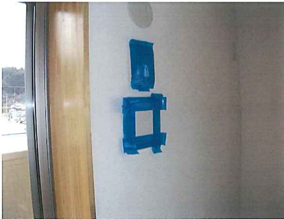
写真：O2_リビング 換気レジスター目張り状況