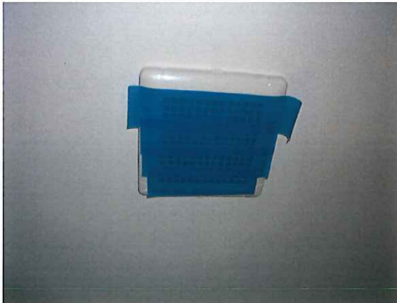
写真：O4_浴室 換気扇目張り状況