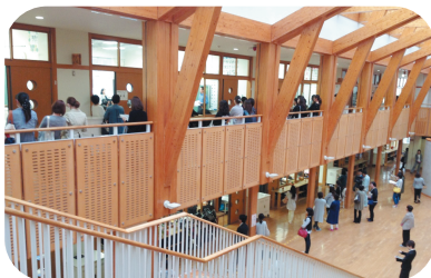
【モダンデザインの校舎】

運動会は縦割対抗で競います。毎年白熱した戦いが見られ、学級や学年の枠を超えた連帯感が生まれています。