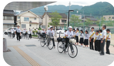
【あいさつ運動・下校促進運動】

中学校に新見市長をお招きし、質問や意見交換をしました。これからの新見市を考えることのできるよい機会となりました。