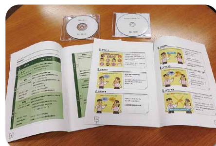
授業展開例、ワークシート、スライド等を CDにも収納

事業成果として、教育関係者と消費者行政関係者の連携が強化され、学校教育現場と消費者教育に対する相互理解が深まっています。また、大学生が参加することにより、大学生自身の消費者市民社会への参画醸成が図られるとともに、中学校・高校生側でも、親近感を持って授業内容に取り組むことができました。