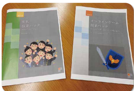
契約授業パックとオンラインゲーム 授業パック