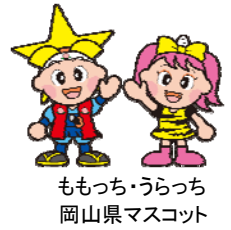
ももち・うらっち 岡山県マスコット