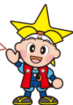
岡山県マスコット「ももっち」

今回の調査では「 自分の思いや考えをどのように英語で表現したら伝わるか 」を考え解答することが求められたよ。実際のコミュニケーションの場面で活用できる英語の習得を目指す方向性が示されていることから、生徒が「 自分の思いや考えを発信する授業づくり 」が、より一層求められていると言えるね。