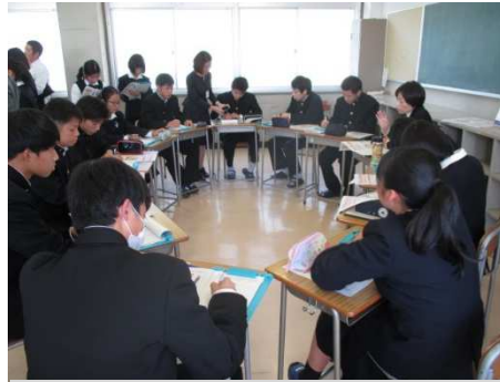
「地域の方との交流会で、地域は自分達で変えることができるのでは、と感じた」