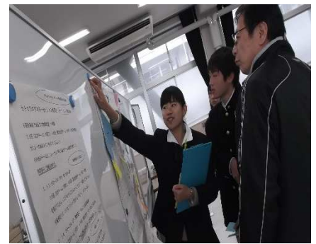
「備前市の観光に提案。ストーリーを考えることにやりがいを感じた」