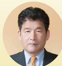
小野 泰弘 議員