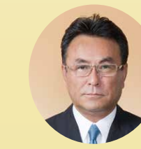
神宝 謙一 議員