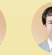
森脇 久紀 議員