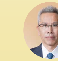
加藤 浩久 議員