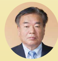
波多 洋治 議員