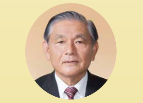
西岡 聖貴 議員