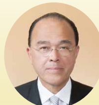
千田 博通 議員