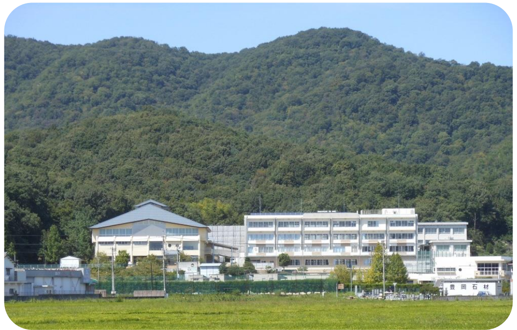
総社市立総社中学校