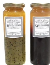
※種類は選べません