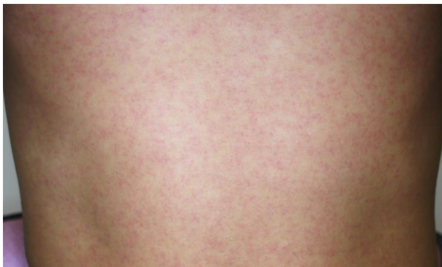
図3. ジカウイルス病の斑状丘疹様の発疹

潜伏期間は、2～12日（多くは2～7日）である。ジカウイルス病の臨床症状は多彩であるが、斑状丘疹様の発疹（ 図3 ）は90～100%に認められるのに対して、発熱の頻度は35～65%とされている 29,47 。また発疹は掻痒感を伴うことが多いとされている。また、大半の症例は入院を必要としなかった。 表7 に2015年のブラジル・リオデジャネイロにおけるジカウイルス病患者が発症後4日以内に認めた臨床症状を示す 47 。