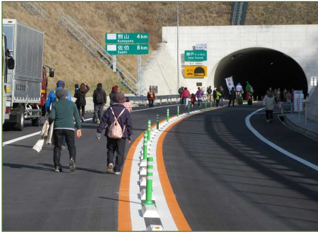
【記念ウォーク(瀬戸トンネルに向けて)】