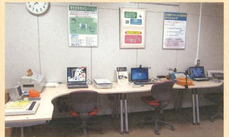
上肢・視覚などの各種障害に対応した機器や意思伝達装置を展示し 展示機器は自由に体験でき相談や説明も受けることができます。