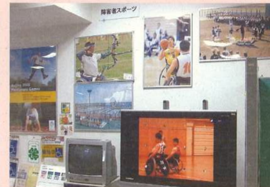
全国的に盛んな障害者スポーツの活動を、パネルで情報発信をしています。