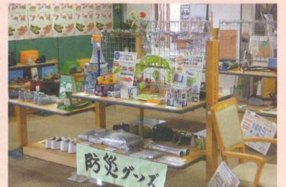
近年、防災意識が高まる中で、障害のある方や、高齢の方が容易に使える防災グッズを展示しています。

上記団体が行っている事業について各ホームページでも紹介しております。詳しくは裏表紙のURLを入力してご覧ください。