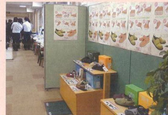
展示場入り口横の特設スペースで三ヶ月ごとに特定の福祉用具をピックアップして提案しています。