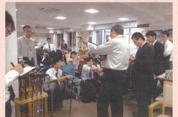
専門相談員のアドバイスを受けられるほか、各種団体等の研修の場としても活用できます。