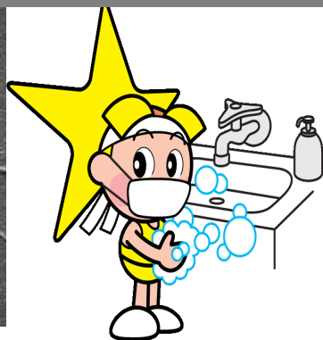
「岡山県マスコット ももっち」