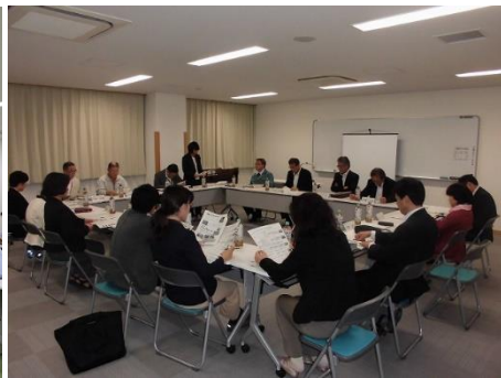
運営委員会(事務局)