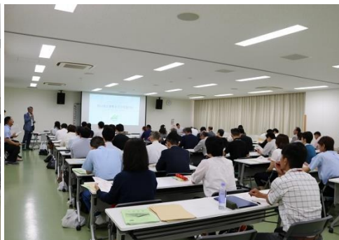
事業所参観日(就労班)