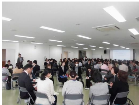
ふくしの参観日(福祉班)