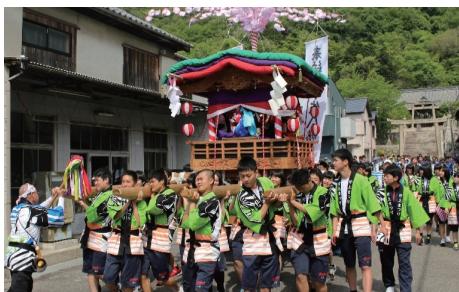
＜チョイヤサ祭り＞ 復活した祭りに貢献