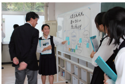
海を救うため、プラゴミについて考えました。 文部科学省の先生にも発表を見ていただきました。