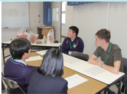
こくさいフォーラム in Wake

和気閑谷高校では、総合的な探究の時間「閑谷學」を3年間で4単位設定し、地元2市1町の役場や教育委員会、商工会等、地域のサポートを受けて、地域課題解決型探究学習を展開します。また、海外の高校5校と姉妹校協定を結んでおり、往き来して交流をしています。さらに、県内在住の留学生を招き、ワークショップを通して海外の文化を学びながら、自分が生きる地域と世界について英語を活用して体験し、グローバルにもローカルにも共通する知見を学んでいます。