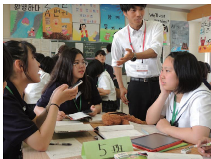
韓国沃川高校との交流