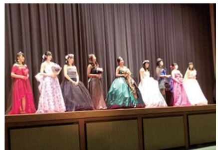
努力の結晶、ファッションショー♪