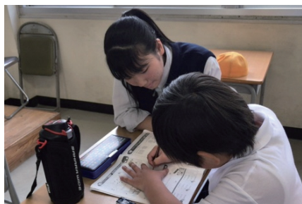
＜片上小学校算数教室＞ 児童への学習支援

備前緑陽高校では、生徒が30種類以上もの社会貢献活動の中から、自分に合った活動を自主的に選択し、参加します。