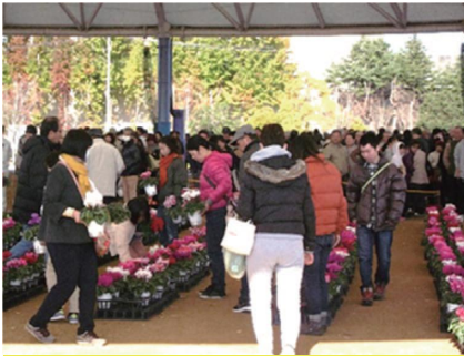
手塩にかけたシクラメン！