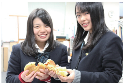
食品ロスを考える。 地元のパン屋さんとコラボしました。

瀬戸高校では、地域社会に貢献する生徒、卒業後も向上心を持って学び続ける生徒を育成するため、瀬戸高で付けたい6つの力を身に付ける取組を推進しています。