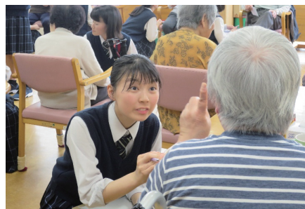
＜デイケア訪問＞ 施設利用者とのふれあい