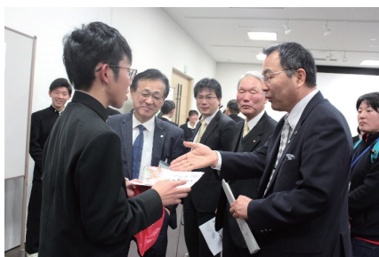
赤磐市長・岡山市長・真庭市長と商談！

3年次は、「D☆ラボ」で、生涯にわたって学び続けるための「学びの設計書」をつくります。