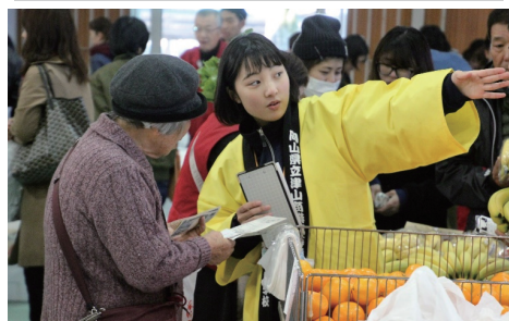
お客様に対して丁寧な案内