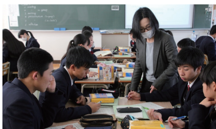
おすすめ商品を英語で紹介