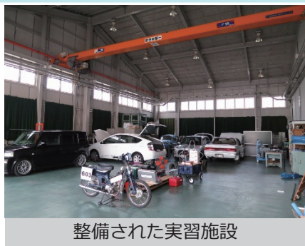
整備された実習施設