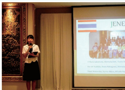
作成したスライドでプレゼンテーション