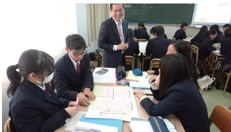
魅力ある店舗づくりのための戦略会議