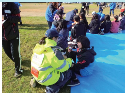
津山市総合防災訓練※②

○津山東高校看護科は、地域の医療に目を向け、地域医療に貢献できる人材を育成し、卒業後も向上心を持って学び続ける生徒を育成しています。