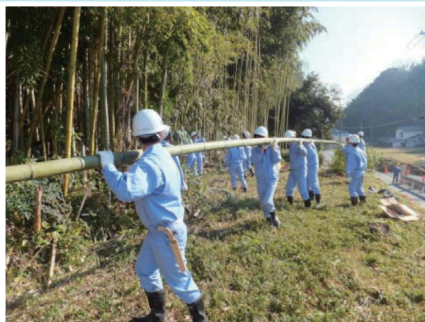
竹の伐採から運び出し