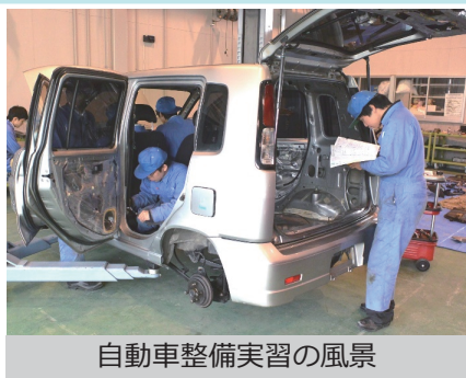
自動車整備実習の風景

総合学科自動車系列では、3級自動車整備士受験資格が得られる 県内公立高校では唯一の高校 です。専用の実習施設もあり、日々資格取得を目指して知識・技術を身に付けるために取り組んでいます。