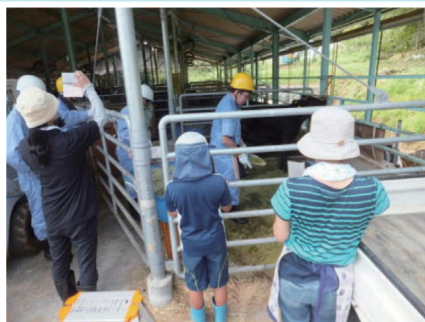
竹チップの牛舎敷料

津山工業高校では、平成27年から、地域に広がる竹林の有効活用に全科で取り組んでいます。竹炭作りから始まり、現在は竹の消臭作用に着目した牛舎の敷料への活動などに取り組みが拡大しています。