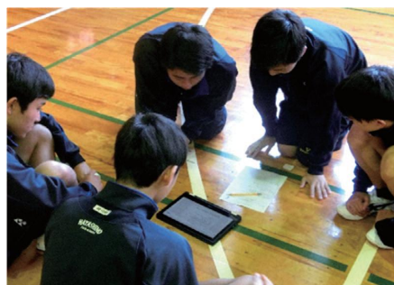
自分のプレーを振り返り