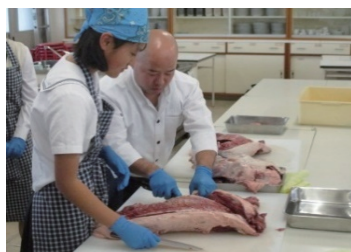
ジビエ料理講習会