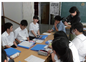
地域に繰り出し、地域課題を協議