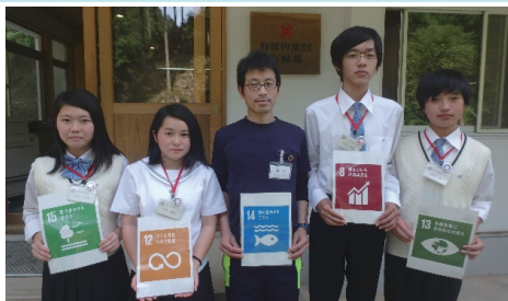
【落合校地】地元メディアと協働して真庭市の企業を訪問。SDGsについてインタビュー。