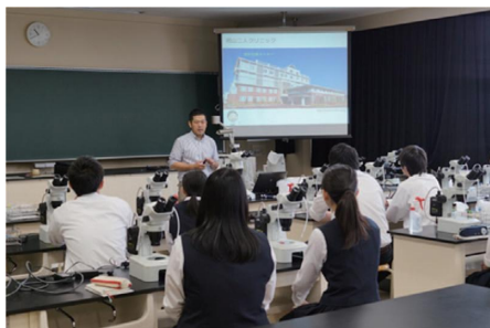
【学校設定科目「サイエンス」】 (メディカルサイエンスI ワークショップ)

津山高校は、平成24年度から文部科学省のスーパーサイエンスハイスクール（SSH）の指定を受け「VGRの育成」を学校全体でめざしています。この事業を最大限に活用し、学校設定科目「サイエンス」や各種研修で、大学の先生の講義や地域との連携など全国に誇れる取組をしています。