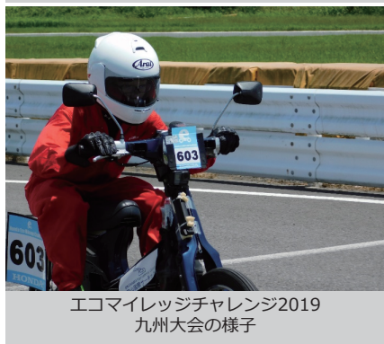
エコマイレッジチャレンジ2019 九州大会の様子

また、今年度より エコカーにも取り組んでいます 。自動車・バイクに興味のある中学生、ぜひ勝間田高校へ！！