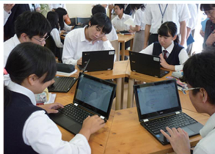
課題についてディスカッション

林野高校では、生徒が一人1台ノート型PC「Chromebook」を所有し、授業をはじめ、学校生活全般で活用しています。敷地内のWi-Fi整備率は100%で、いつでもどこでも使うことができます。わからないことをすぐに調べられるのはもちろん、皆で意見を出し合ったり、一つの課題を仕上げたりなど、協働的な学びの創造を可能にしています。