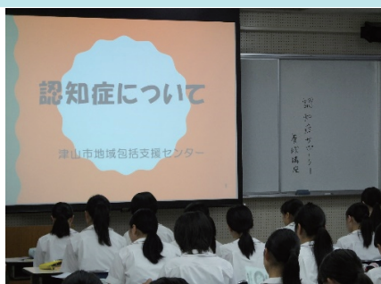
認知症サポート研修※①