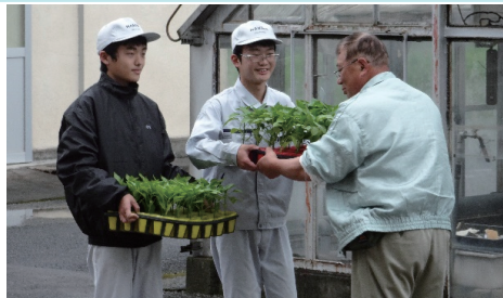
【久世校地】地域とつながる「ミニパブリカ」の育苗と提供で持続可能なまちづくり。