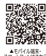
▲モバイル端末、スマートフォンはごちよ

〒700-8570 岡山市北区山下2-4-6 https://www.pref.okayama.jp/site/gikai/