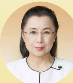
蜂谷 弘美 議員