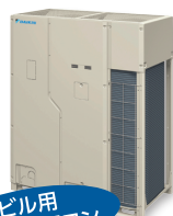
ビル用 マルチエアコン