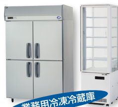
業務用冷凍冷蔵庫