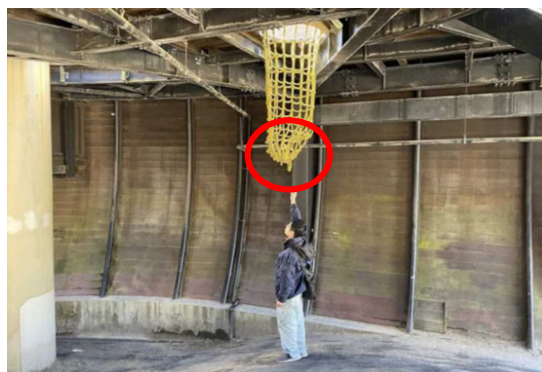
事故と同種のネット（袋状の下部が破れた）