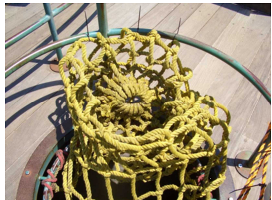
事故と同種のネット