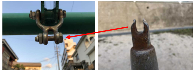
摩耗により上部がすり減り破断した吊り金具の状況（右写真）