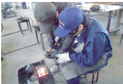
工業高校での溶接実習