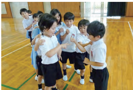
近隣小学校との交流活動