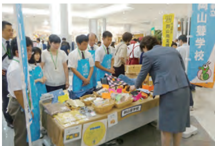
キャリア教育フェア