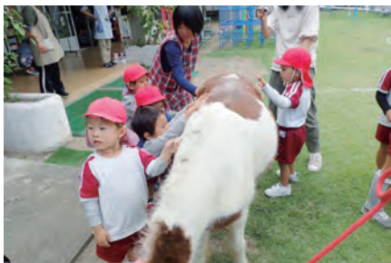
心が動かされる体験

110年の実績を誇る県内唯一の聴覚障害特別支援学校です。幼稚部から高等部まであり、聞くことが不自由な幼児児童生徒を対象として、補聴器などを活用して言葉の習得を促したり、様々なコミュニケーション手段を活用し、「生きる力」を身に付けるためのきめ細やかな指導や自立に向けた専門的な教育を行ったりしています。