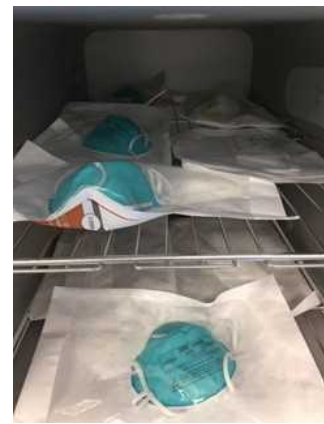
図 2：ロード用の N95 マスクの包装と棚への積載例