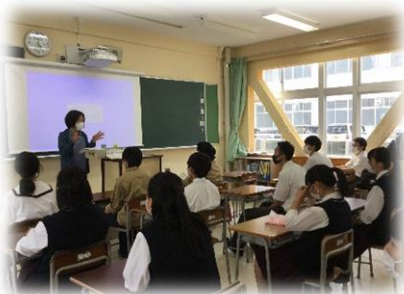
外部講師による選句指導