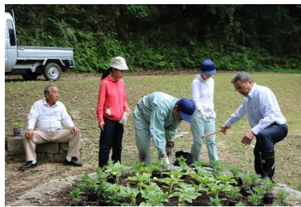
真備公園の花植(環境班)