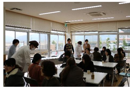
子育てIUP講座(福祉班)