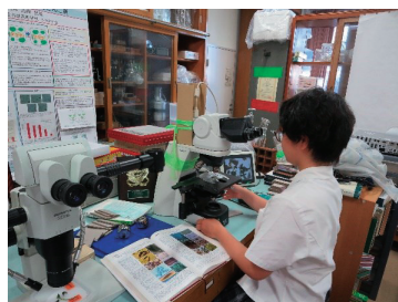
植物病原菌の基礎研究

園芸科が栽培した綿は家政科がデニムバッグに縫製し、市内小学生へ贈呈しています。また、普通科生徒は、園芸科が初栽培している藍に発生する植物病原菌の基礎研究に着手しました。地場産業を通じた学びの過程で、郷土愛を育みながら井原の魅力を発信しています。