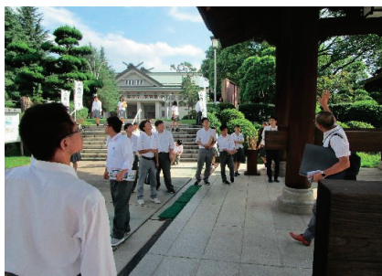
「ASビジネス・情報系列」 フィールドワーク！