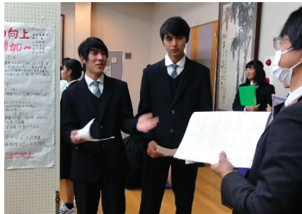
3年間の探究活動で 高い課題解決能力が身につきます

1年は地域課題、2年は興味のある 課題、3年は社会の諸問題を扱 い、論理的思考力が身につきます。