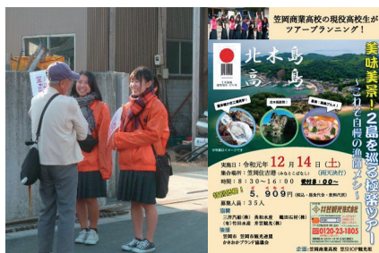
R1 観光ツアー（観光班）

「笠SHOP」とは、3年生の授業「課題研究」の講座のひとつでいまや笠商ブランドとも言えます。商品開発と販売を行う商品開発班と笠岡諸島等の観光ツアーの企画・実施をする観光班に分かれて活動しています。地域の方の協力を得ながら取り組んでおり、地域では大変好評です。また、多くの人たちと関わることによって、コミュニケーション力、プレゼンテーション力、責任感などを身に付けることができ、わが校自慢の取組です！