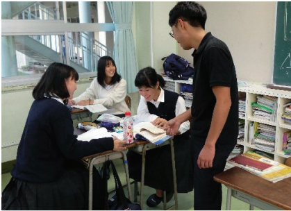
「習熟度別少人数授業」と「3つの学びのコース」で きめ細かにサポートし、能力を最大限に伸ばします