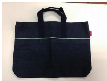
デニムバッグ製作

井原高校は、2018年度におかやま創生高校パワーアップ事業の指定を受け、「地域に求められる学校づくり」をテーマに、3学科がそれぞれの特長を生かして、地域活性化を推進しています。