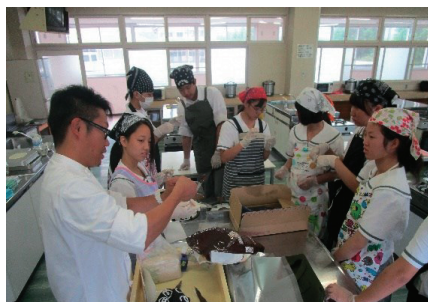
「職業別交流学習」 パティシエの方と実習！

本校では、「あさくち山環学プロジェクト」と名付けて、科目「AS系列」（学校設定科目）といった探究活動やボランティア活動などを実施しています。令和元年度から岡山県の「高等学校魅力化推進事業（リージョナルモデル）」の指定により、配置されたコーディネーターと協働しながら、地域のいろいろな職業の方に学ぶなど、更なる魅力化を進めています。「職業別交流学習」や「系列別体験学習」などの活動を通じて、生徒の自主性や自己有用感等を育み、社会に貢献する人材を輩出しています。