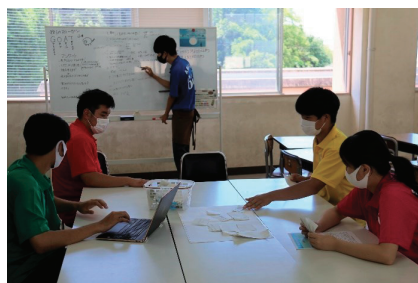
開発ミーティング（商品開発班）

「笠SHOP」とは、3年生の授業「課題研究」の講座のひとつでいまや笠商ブランドとも言えます。商品開発と販売を行う商品開発班と笠岡諸島等の観光ツアーの企画・実施をする観光班に分かれて活動しています。地域の方の協力を得ながら取り組んでおり、地域では大変好評です。また、多くの人たちと関わることによって、コミュニケーション力、プレゼンテーション力、責任感などを身に付けることができ、わが校自慢の取組です！