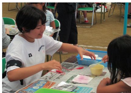
「科学の祭典」 ボランティア活動！

本校では、「あさくち山環学プロジェクト」と名付けて、科目「AS系列」（学校設定科目）といった探究活動やボランティア活動などを実施しています。令和元年度から岡山県の「高等学校魅力化推進事業（リージョナルモデル）」の指定により、配置されたコーディネーターと協働しながら、地域のいろいろな職業の方に学ぶなど、更なる魅力化を進めています。「職業別交流学習」や「系列別体験学習」などの活動を通じて、生徒の自主性や自己有用感等を育み、社会に貢献する人材を輩出しています。