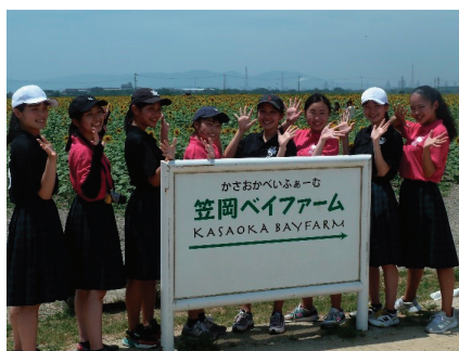
フィールドワーク（観光班）