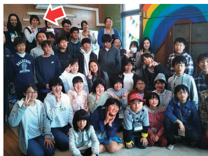
矢掛小中高ども連合（YK60）

「地域に支えられ、地域を支える高校」を目指している矢掛高校には、地域連携のプロである「地域協働活動コーディネーター」が存在します。