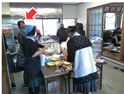
地域連携行事（山ノ上干し柿祭り）