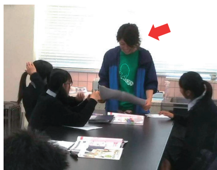
ESDタイム（総合的な探究の時間）