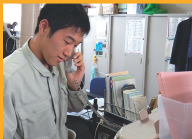
依頼者への電話連絡