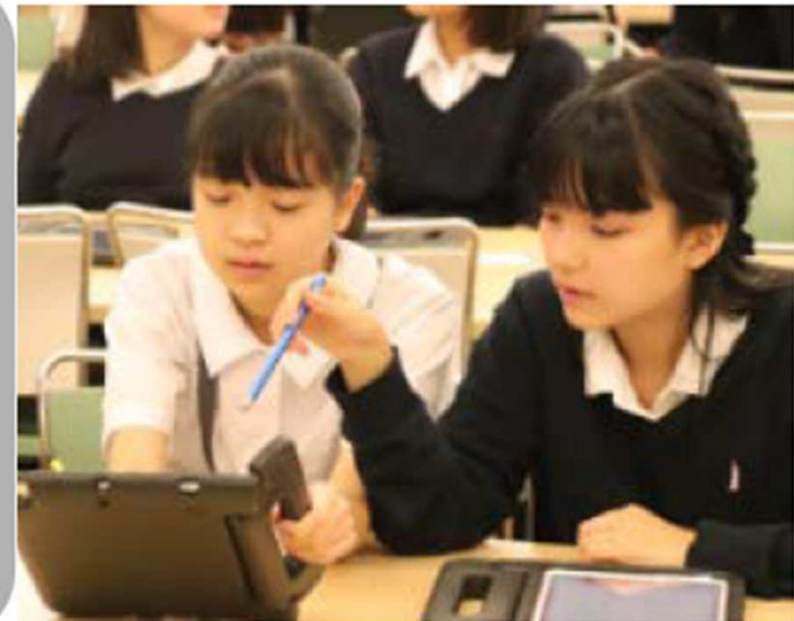
千代田区立麹町中学校の授業にて、英・数を実証中