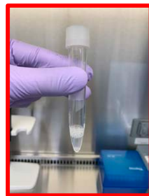
泡が多い 十分量採取されていない