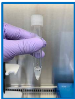
泡が少ない 十分量採取されている