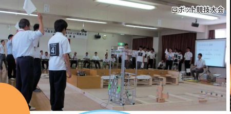
ロボット競技大会