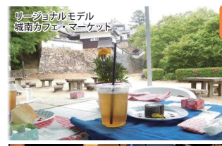
リージョナルモデル 城南カフェ・マーケット