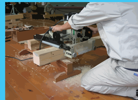
機械操作作業 仕口ルーター