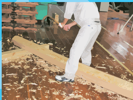
手斧(ちょうな)はつり作業