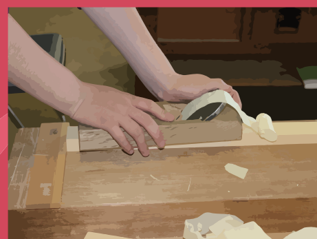
手かんによる仕上げ削り作業