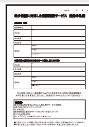
電話通訳サービスの 申込書

※登録前の緊急時利用の場合は、下記問い合わせ先（運営事務局）までご相談ください。