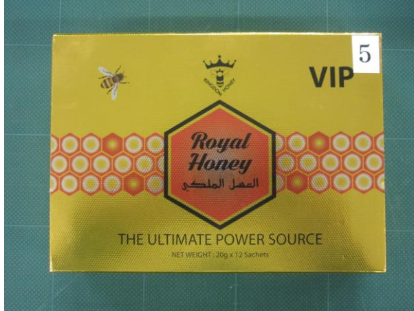
Royal Honey VIP