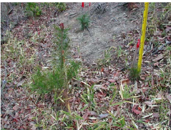
写真-11 3年生苗(左)・1年生苗(右) 植栽2年目 (赤磐・皆伐・地掻区・下刈区)