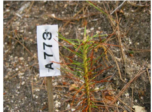
写真-16 1年生苗頂部ウサギ食害