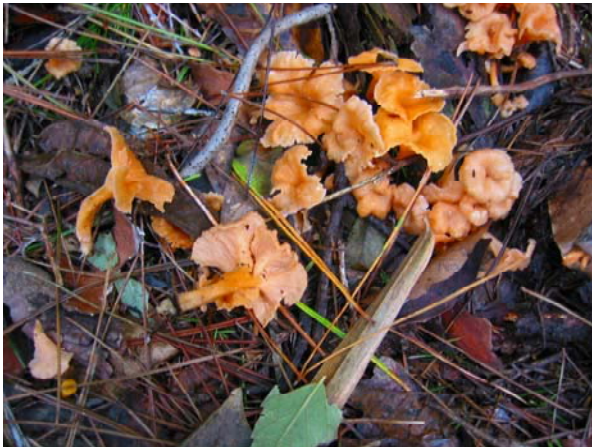
写真-21 トキイロラップタケ（食）