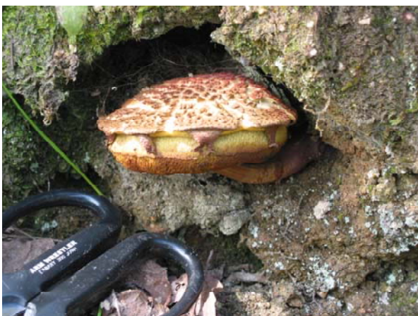
写真-23 キクバナイグチ（食）