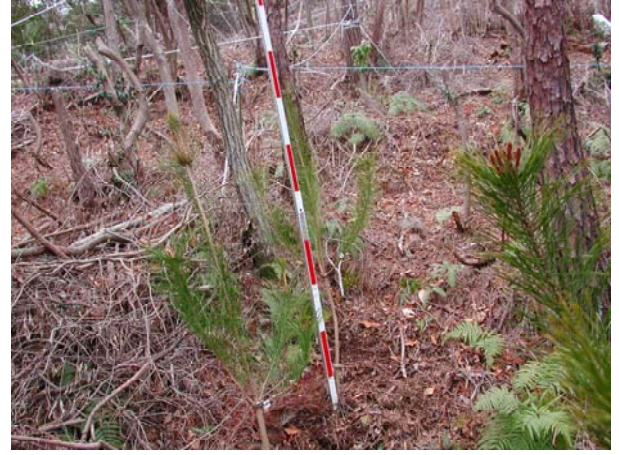
写真-14 5年生苗 (備前・整理伐・未処理)