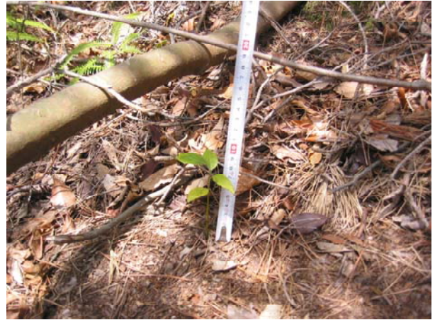
写真-8 稚樹成長状況 (シロダモ・05年)