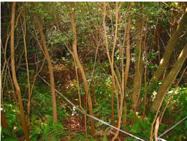
写真-3 試験地林内 (赤磐試験地)