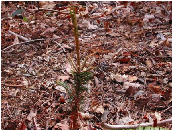
写真-17 3年生苗頂部ウサギ食害・葉部虫害