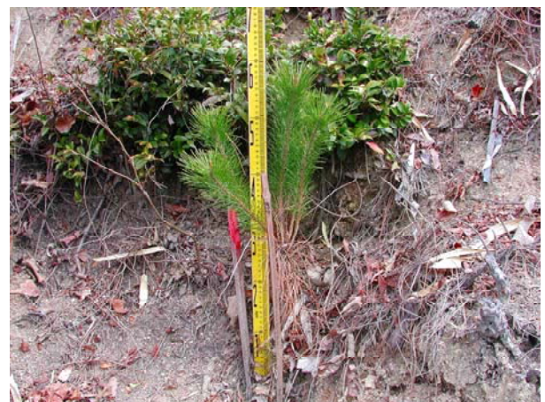
写真-12 3年生苗植栽2年目 (赤磐・皆伐・地掻区・下刈区)