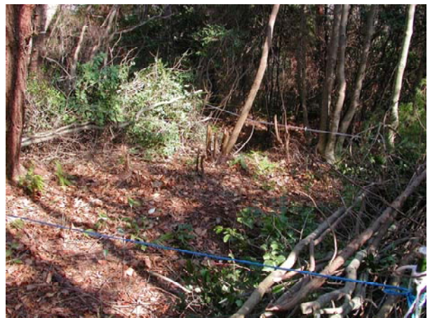
写真-6 整理伐中 (備前試験地)