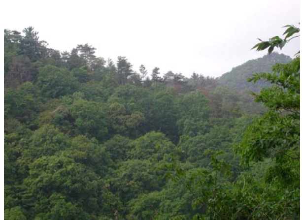
写真-2 試験地遠景 (備前試験地)