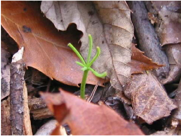
写真-15 播種苗針葉食害