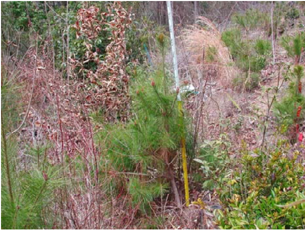
写真-13 3年生苗植栽2年目 (赤磐・皆伐・未処理区・無下刈区)