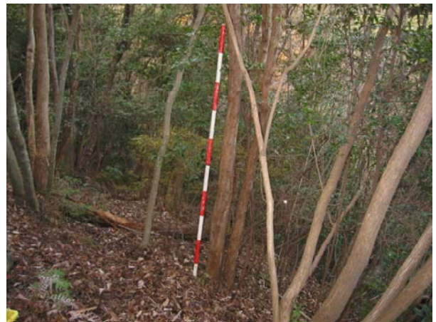
写真-4 試験地林内 (備前試験地)