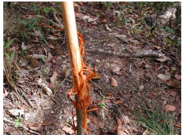
写真-18 5年生苗幹部鹿剥皮害