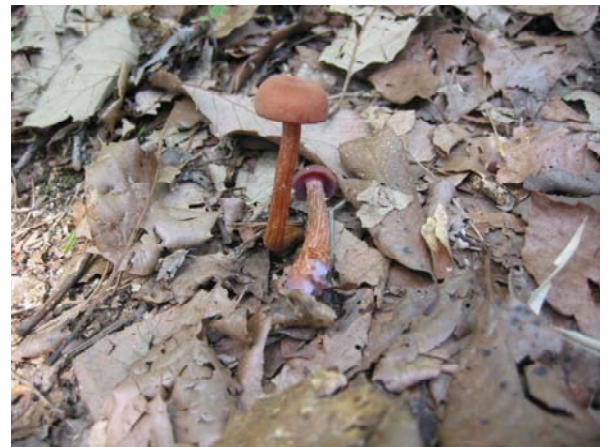
写真-22 オオキツネタケ（食）