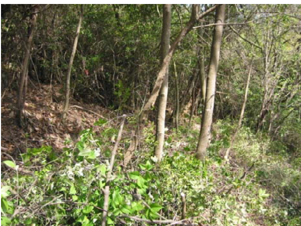
写真-5 整理伐中 (赤磐試験地)