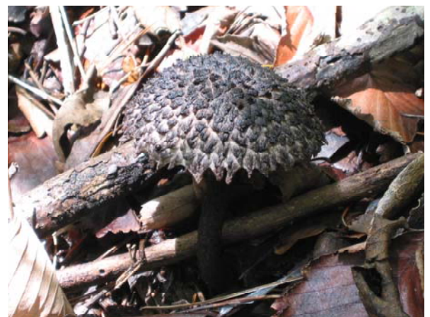
写真-24 オニイグチモドキ（食）

*食毒の区別は、本郷次雄監修：山溪フィールドブックス⑩「きのこ」（1994）による。