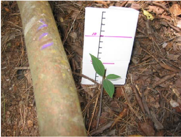
写真-7 稚樹成長状況 (シロダモ・03年)