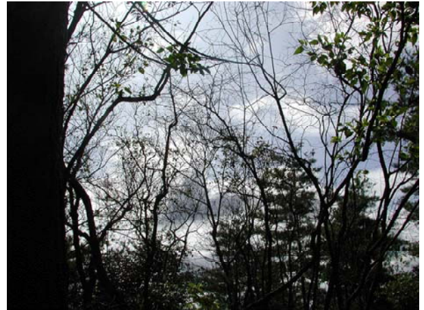
写真-20 薬剤施用後（備前・林冠部）