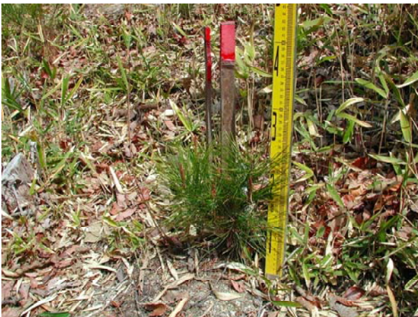
写真-9 播種苗2年目 (赤磐・皆伐・未処理区)