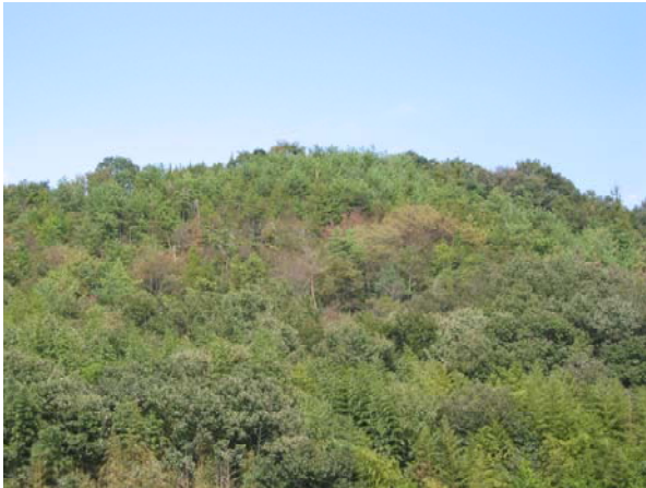
写真-1 試験地遠景 (赤磐試験地)