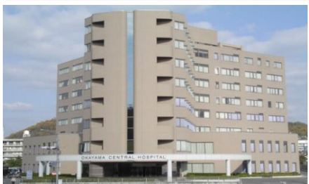
岡山中央病院本館 149床