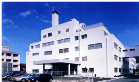
岡山中央奉還町病院 81床