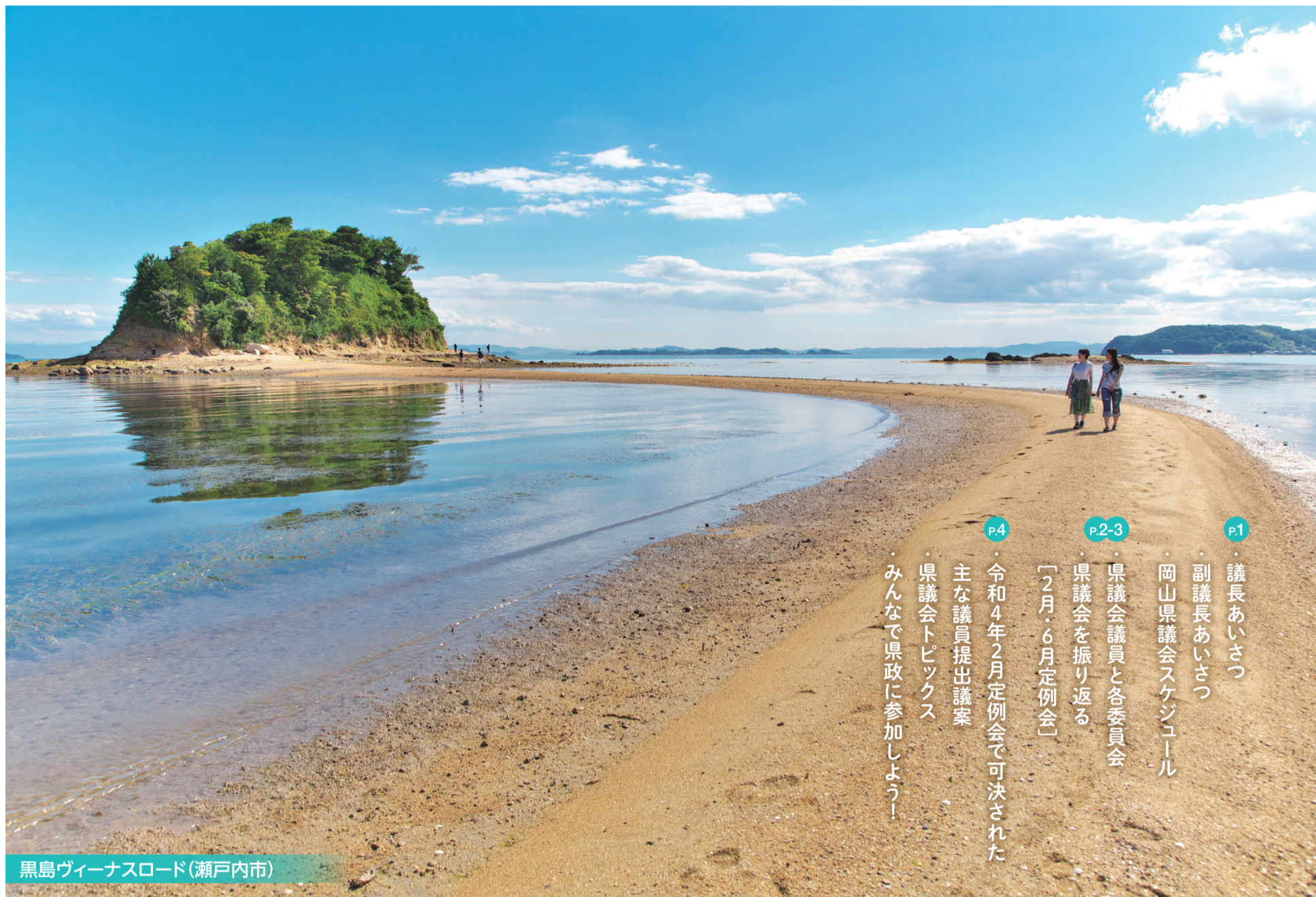
黒島ヴィーナスロード(瀬戸内市)