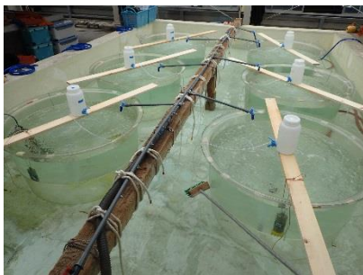
写真2 500L水槽を用いた室内実験の様子

キートセロス属はDIN濃度が高い(約13 \mu M)と8日後に約2万細胞/mLまで増殖したのに対し(図1-a)、低い(約2 \mu M)と最高約6千細胞/mLにしか達せず(図1-b)、十分に増殖しませんでした。