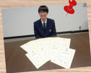
福山地区の企業への就職の道も多数！