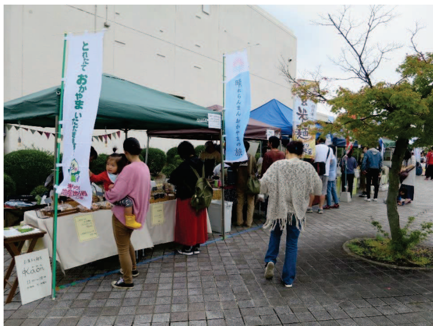
食のサミット (備中地域食の展示)