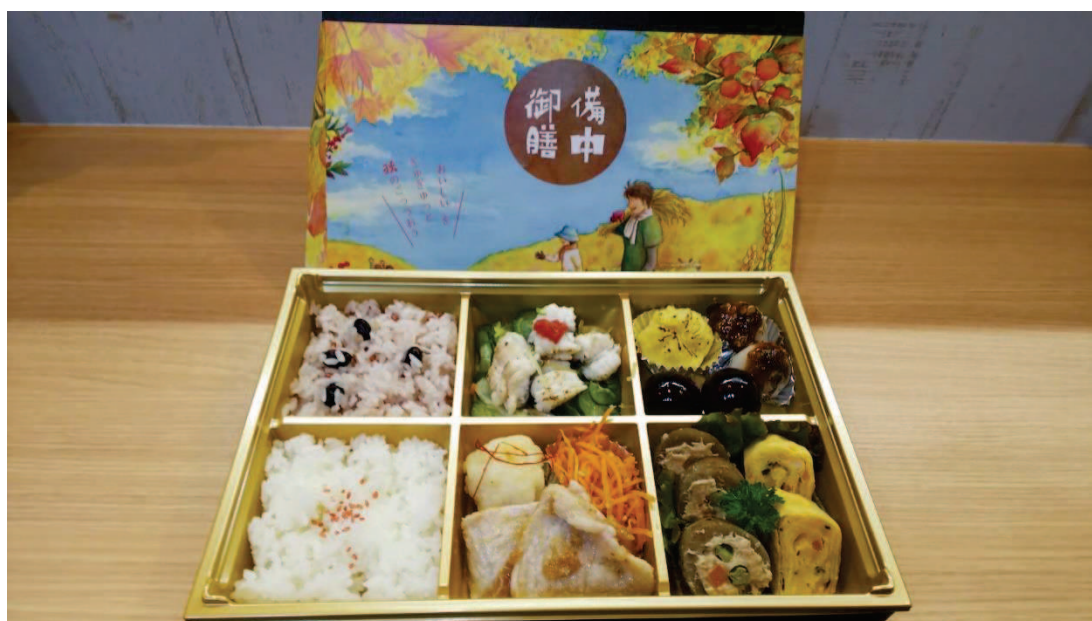
備中膳と ランチョンマット