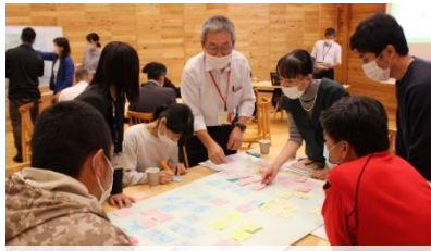
グループでの活発な意見交流 (西粟倉村)

関係者が一堂に会す「第1回西粟倉村学校運営協議会」を「 地域と学校の連携・協働のあり方 」の正しい理解の場とするため、出前説明会を活用されました。その後、「育ててほしい人物像」について考えるワークショップを行い、地域住民、学校教職員、行政関係者等が、地域全体で子どもを育てるために、自身の立場で何ができるか考えました。