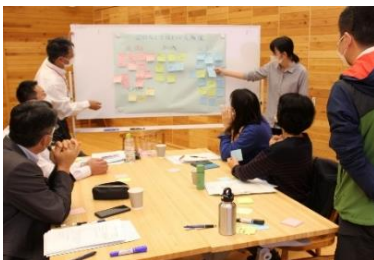
地域と学校で考えを共有 (西粟倉村)

すでに組織がある地域でも 年度変わりの再確認 としての活用もあり、効果的な「地域と学校の連携・協働」の推進や充実が図られています。